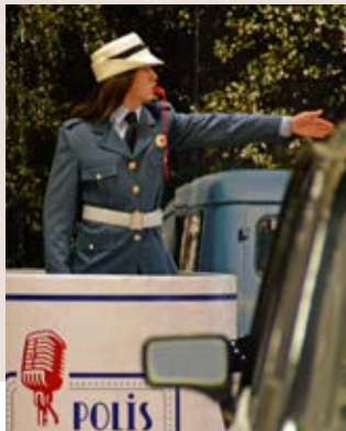
Olay Yeri İnceleme Canlandırması